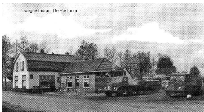
Horecabedrijf De Posthoorn

Voorheen heette dat De Posthoorn. De horecafunctie van de boerderij op de vorige kruising werd naar hier verplaatst.