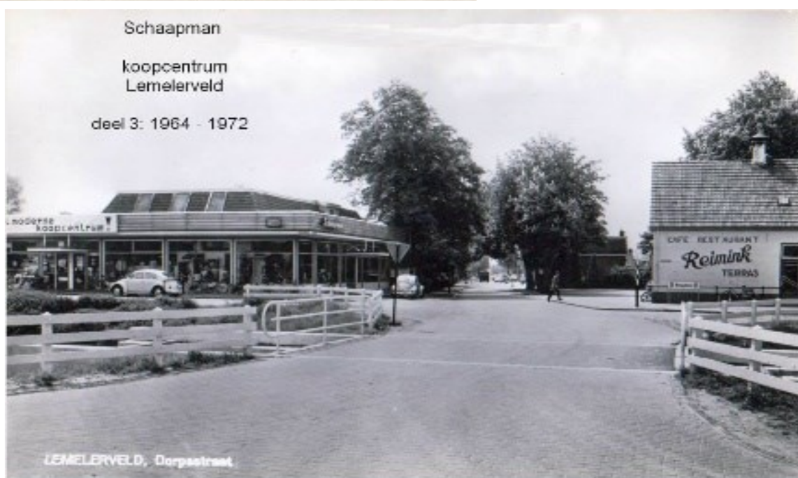
De bedrijven Schaapman en Reimink