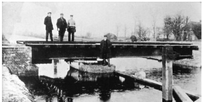
Een foto van het viaduct nu en van de spoorbrug vroeger