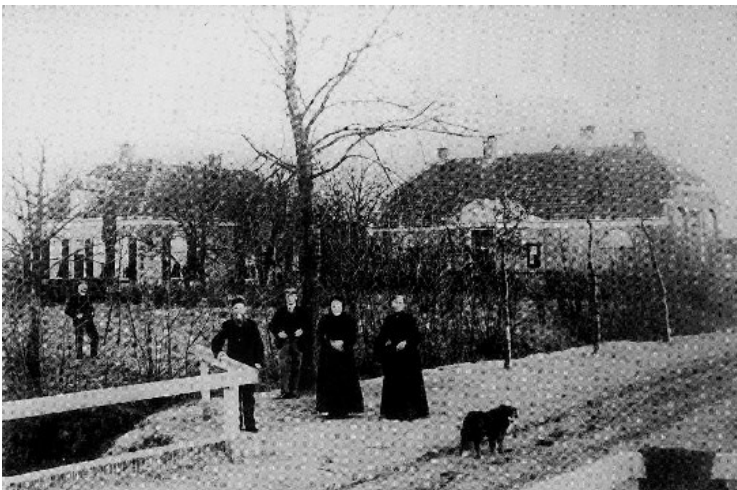
De school en meester Noordman

Bij het kanaal gekomen ziet u aan de rechterkant Het Weerdhuis. Van oorsprong een herberg/woonhuis. Ooit woonde er iemand die Dokter heette en de brug over het kanaal heet daarom de Doktersbrug. Net zoals de buurtschap. Het witte huis daar tegenover is het oorspronkelijke brugwachtershuis.