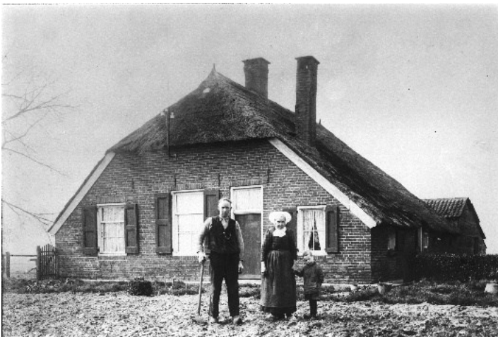
Boerderij Kogelman Dwarsweg

U fietst nu in de buurtschap Strenkhaar, waarvan de zuidkant al bewoond werd voordat de kanalen werden gegraven. Die zuidkant grenst aan de bossen van de zogenaamde Krieghuisbelten. De naam "haar" werd gegeven aan een hoge en lange zandrug, grenzend aan lager gelegen gronden. De hoger liggende gronden zijn hier bijna allemaal geëgaliseerd. Slechts een enkele oude Sallandse boerderij in Saksische stijl herinnert nog aan de vele kleine gemengde bedrijfjes die hier ooit zijn gesticht.