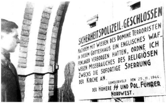
▲ De geref. kerk in Lemelerveld werd na de overval door de S.D. gesloten.

kerkgebouwtje hadden}, zodat de Gereformeerde Kerk Lemele-Lemelerveld ontstond. Vlak na de oorlog kwam zij in het bezit van de Gereformeerde Vrijgemaakte gemeente van Lemelerveld. Tijdens de oorlog waren er wapens in de kerk opgeslagen, ontdekt bij een inval van de Duitsers, waarbij de in het verzet actieve dominee Vogelaar ternauwernood wist te ontsnappen. Het bord waarmee de Duitsers de sluiting van de kerk bekendmaakten hangt nu in de kerk.