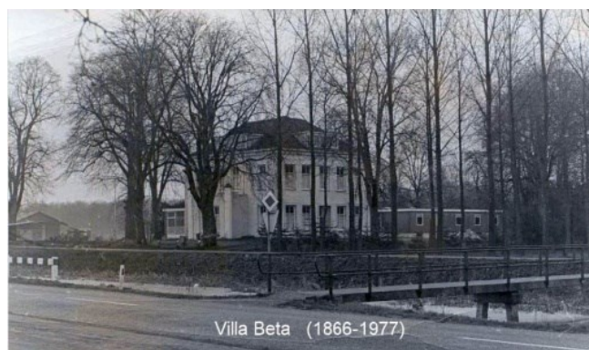
Foto van het huis